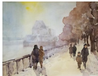
Walter Raab (8 Werke) Aquarell, gerahmt/ungerahmt 45 x 35 cm Startgebot: 250 €