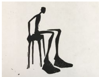
Hannes Helmke (2 Werke) Papierarbeit, gerahmt 20 x 30 cm Startgebot: 150 €